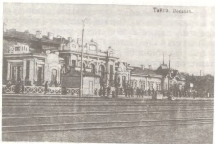
Ст. Тайга Сибирской ж.д.